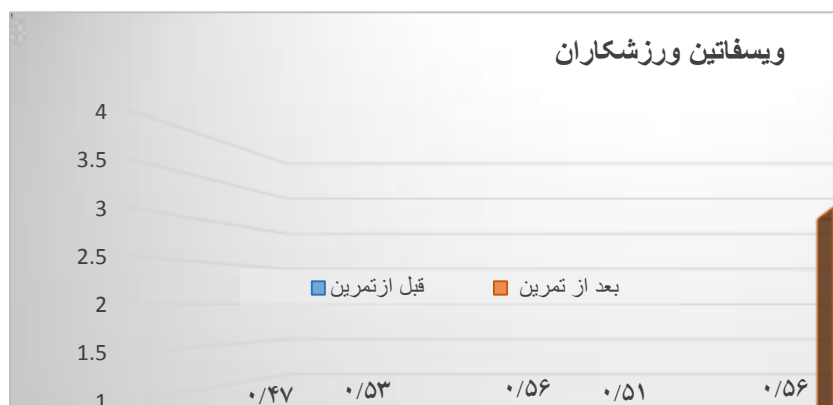
شکل ۲. میانگین ویسفاتین ورزشکاران قبل و بعد از تمرین در چهار گروه

برای آزمون اثر تمرین با شدت بالا بر سطوح استراحتی ویسفاتین در افراد غیر ورزشکار و کاراته‌کاران نخبه پس از مصرف مکمل امگا ۳ از تحلیل واریانس استفاده گردید. نتایج تحلیل واریانس عاملی بر مقادیر ویسفاتین در جدول (۳) ارائه شده است.